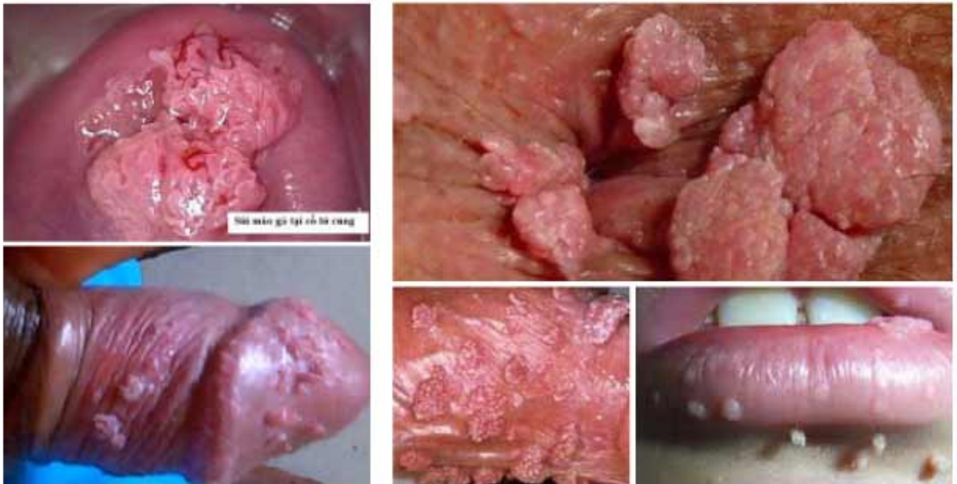
Hình ảnh sùi mào gà hậu môn

kể đến ở vùng hậu môn là nơi mà bệnh sùi dể lan rộng nhất.