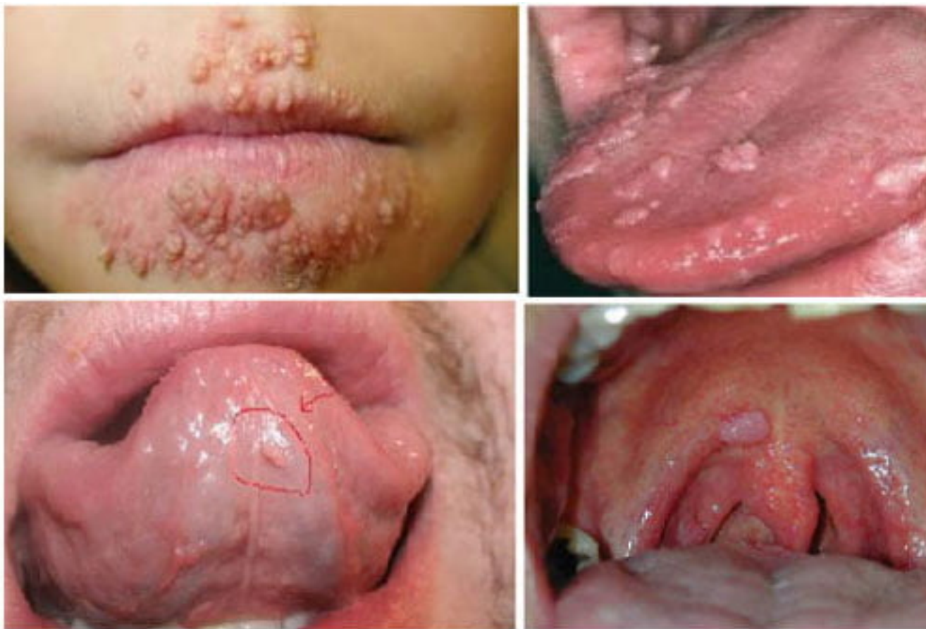
Hình ảnh bệnh mào gà tại con đường miệng

nhiên lại dễ nhầm với một số bệnh khác như: nhiệt miệng, nhiễm trùng, gai lưỡi..