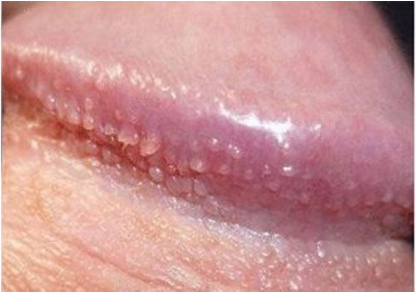
Hình ảnh bệnh mào gà tại nam giới giai đoạn đầu