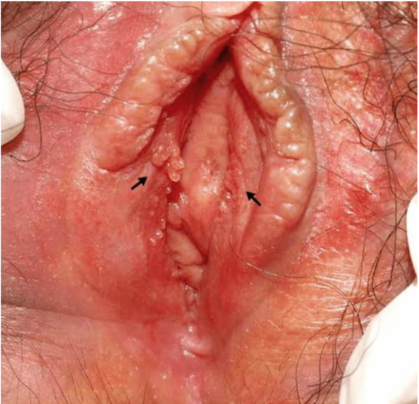
Hình ảnh bệnh lý sùi mào gà ở phụ nữ